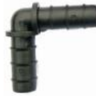
Φ16 滴灌管弯头 型号: DG5314 用于滴灌管，采用倒钩内插式接头连接。