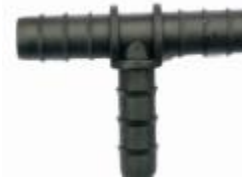
Φ16 滴灌管三通 型号: DG5313