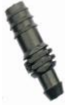
Φ16 滴灌管旁通 型号: DG5511